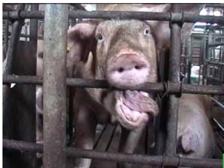
Březí prasnice se v kleci nemůže ani otočit. Fyzické i psychické strádání se projevuje stereotypním chováním, jako je okusování kovových zábran.