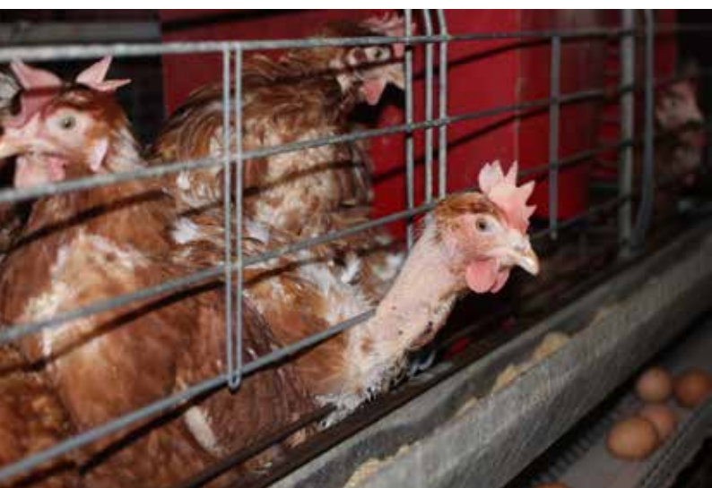
Obohacené klece slepicím život nezlepšily.

Málokdo ví, že králíci jsou druhým nejvíce chovaným hospodářským zvířetem v EU. Podle statistiky FAO se v EU každoročně vykrmuje na maso přes 330 miliónů králíků a z nich 99 % stráví život v klecích.