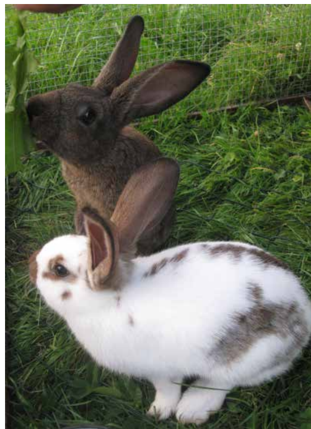
Venkovní chov umožňuje králíkům chovat se přirozeně.

Je kruté a zbytečné chovat králíky v klecích, a proto byla před rokem vyhlášena celoevropská petice, která žádá Evropskou Radu a ministry zemědělství členských států, aby přijali účinná opatření, která zajistí, že králíci nebudou chováni v klecích alev humánních podmínkách. Petice, kterou již podepsalo více než 430 000 občanů EU, bude v březnu předána Evropské radě.