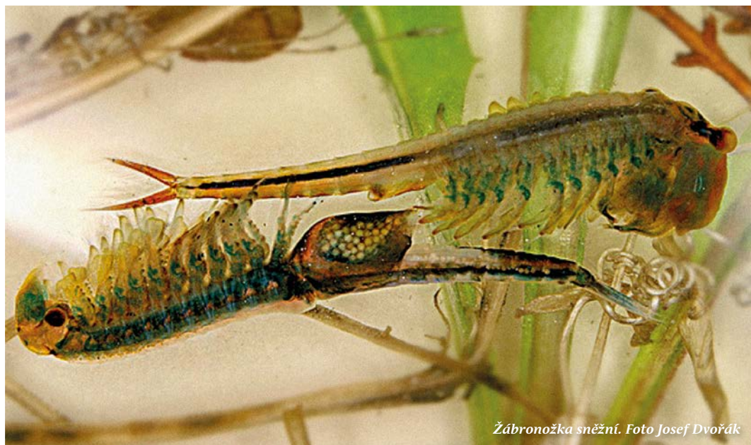
Žábronožka sněžní.

Některé jsou stálé, ale většina se vytvoří na jaře, když taje sníh, a poté je sluníčko vysuší – říká se jim periodické tůně. I když jsou na světě jen krátkou dobu, žije v nich mnoho zajímavých a vzácných živočichů. Jedním z nich je zábronožka sněžní – malý korýš, který umí okouzlit barevnou hrou žaber a nožek. Žije krátce – jen dokud je v tůni voda, po zbytek roku odpočívají na suchém dně tůně jen velmi odolná vajíčka.