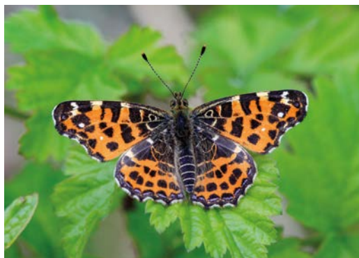
Babočka sítkovaná.

Vystřiženého motýla z šablony pak můžete polepit nasbíranými lučními květy, stébly trávy a rozličně tvarovanými listy, plochy vysypat