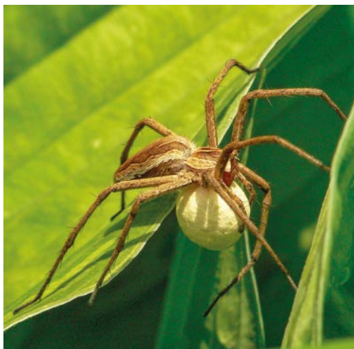
Lovčík s kokonem.

sítě ani nestaví a můžete je zahlédnout běhat po zemi nebo šplhat po rostlinách. Jsou často velmi skrytí. Nápadnými se někteří stávají v období, kdy samičky nosí pod zadečkem bílou kuličku – tzv. kokon. Je to vlastně taková hedvábná kolébka pro malé pavoučky, kterou s sebou stále nosí. Mezi takové patří třeba téměř všudypřítomní lovcíci. Bez kokonu byste si ale lovcíků nejspíš ani nevšimli – jsou na půdě dokonale maskování hnědým pruhováním a rychlí jsou jako střela. Možná vás pak překvapí, že najdete podobně zamaskované i různě pestré pavouky na květech či listech rostlin. Nejznámější z nich jsou běžníci.