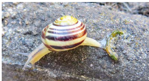
Šnečí trus.