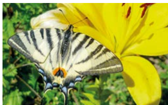
Otakárek ovocný