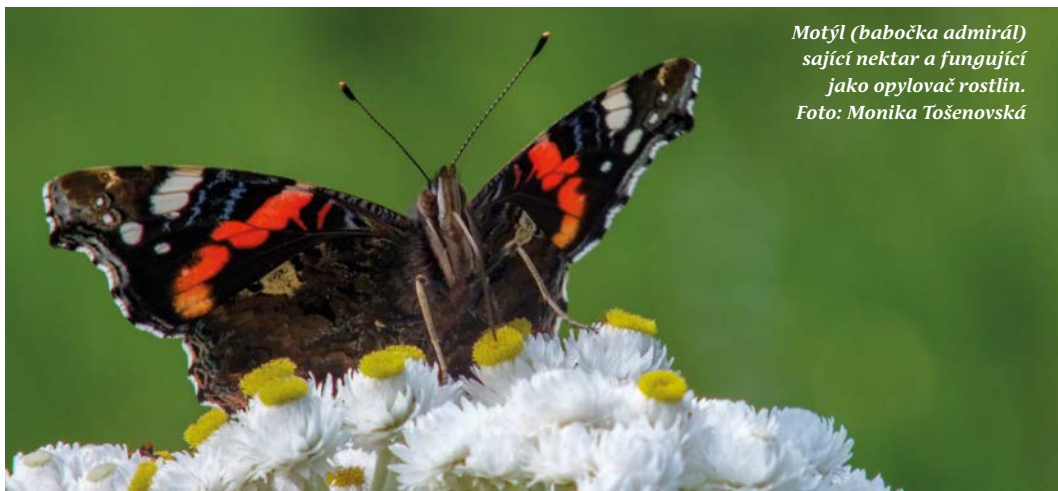
Motýl (babočka admirál) sající nektar a fungující jako opylovač rostlin.

živočichy. Někdy nás motýli trochu pozlobí – třeba když si housenky běláška zelného pochutnají na naší úrodě, nebo když se moli pustí do zásob ve spíži či ve skříni. Jindy nás překvapí – třeba v zimě na chalupě, když zatopíme a teplo je vyláká ze zimního spánku (některé druhy přezimují jako dospělci – ukrytí na půdách, v dutinách stromů, jeskyních; jiné druhy přezimují jako housenky nebo vajíčka; některé druhy dokonce odlétají na jih – např. babočka bodláková).