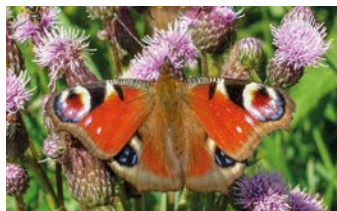
Výstražný motýlí šat