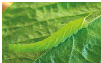
Housenka s krycím zbarvením