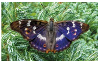
Batolec duhový

šatí i motýlí housenky – některé jsou výstražně zbarvené a mohou mít i dráždivé chlupy na svou obranu, jiné jsou nenápadné a splývají se svou živnou rostlinou.