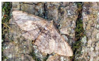
Maskovací motýlí šat