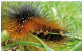
Housenka s agresivními chlupy