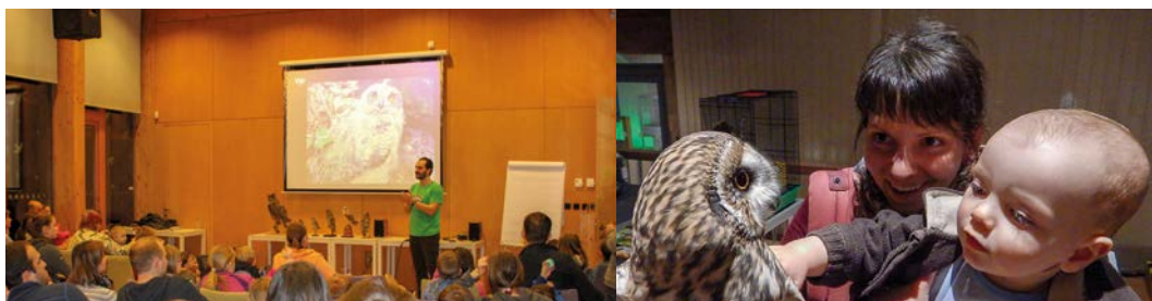
Přednáška odborníka ČSO a ukázka handicapovaných sov s možností se pod dohledem sovy šetrně dotknout

Zkuste se proměnit v sovu. Na soví masku budete potřebovat tvrdý papír, tužku, pastelky, nůžky, tenkou gumičku a spoustu fantazie. Potom můžete s kamarády vylétnout!