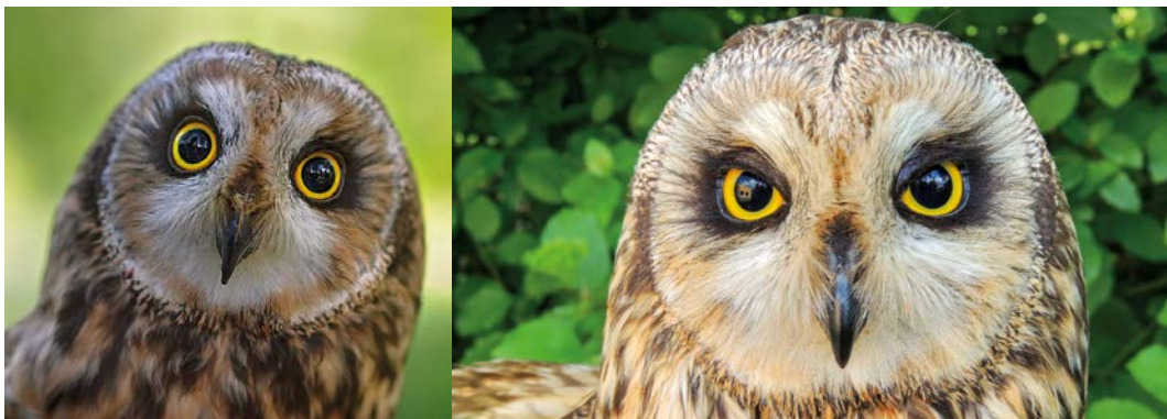
Jeden z trvalých handicapovaných živočichů v záchranné stanici Ornis – kalous pustovka – dokazuje, že i sovy se umí různě tvářit. Možná i proto jsou nám lidem tak blízké...

Vyvrcholením večera je společná výprava do přírody v blízkém okolí Sluňákova. Cestou se ještě dozvíme několik dalších zajímavostí o tajemných strážcích noci, ale hlavně se budeme snažit ztišit a se zbystrěnými smysly „číhat“ na naše „úlovky“. Pomůže nám i nahoukávání odborníkem – a umí to nejen s využitím nahrávky, ale také svou vlastní pusou a rukama! Možná se to od něj naučíte. Vždy je ale dobré nejdřív poslouchat a nahoukávání (odborně se označuje jako provokace nahrávkou) používat jen velmi opatrně a jen pod dohledem zkušeného odborníka (zvířata totiž tímto vždy „zdržujeme“ od toho, co potřebují dělat a zbytečně je proto tímto nikdy nevysilujeme!). V období února března v našich zeměpisných podmínkách probíhá páření většiny druhů sov a jejich hnízdění (zakládání snůšek), a tak se dají samice nalákat houkáním samců a další samci tímto houkáním vyprovokovat (houkání slouží zejména k označení teritoria). Přesto si musíme připustit, že by byla vlastně velká náhoda a štěstí dnes sovu zaslechnout či zahlédnout. Přece jen jsou to velice tajuplní, nenápadní, plaší