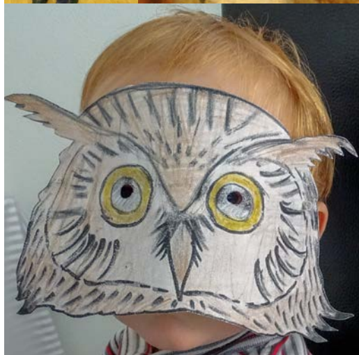
Ukázka her „Odkud letí?“ a „Nakrm soví mláďata“ (archiv Sluňákova); vzor soví masky pro výrobu (Monika Vraštilová)

Na tuto hru budete potřebovat víc kamarádů. Utvořte kroužek a rozdejte si čísla (tolik čísel, kolik je dětí). Jeden z vás si stoupne doprostřed kroužku a zaváže si oči. Stane se z něho sova. Jeho úkolem je vyvolat vždy dvě čísla. Děti s vyvolanými čísly (kořist) se pokusí vyměnit místa, aniž by je sova uprostřed slyšela a chytila. Bude kořist úspěšná a unikne, nebo ji sova uloví?