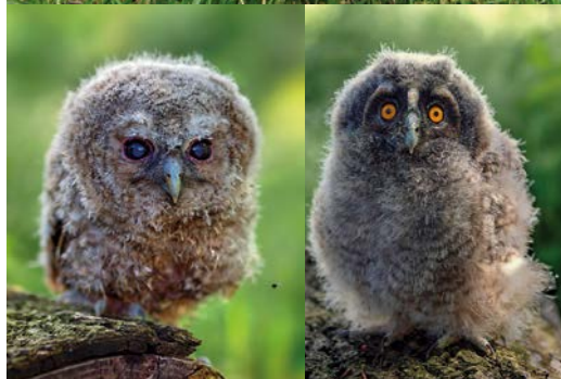
Pro někoho trochu strašidelná a pro někoho ohromně roztomilá – soví mláďata, která se podařilo v záchrané stanici Ornis odchovat a vypustit zpět do přírody; nahoře sova pálená, dole puštík obecný

Dozvíme se určitě něco i o probíhajících projektech ČSO, které se sov týkají. Např. loňský rok byl vyhlášen rokem sýčka a cílem kampaně bylo poukázat na skutečnost, že naše sovy (nejen tento druh) z přírody bohužel rychle mizí a viníkem je často právě člověk a jím způsobené změny krajiny, v poslední době zejména té zemědělské. Snad tomu ale lze zabránit, pokud si to lidé včas uvědomí a budou se snažit o praktická preventivní opatření a ochranu ohrožených druhů. Více jste si o tomto mohli přečíst i v Ptačím světě č.1/2018 nebo na http://www.birdlife.cz/ptak-roku-2018-sycek-obecný/ .