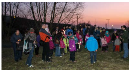
Vycházka s odborníkem ČSO za sovami do terénu v blízkém okolí Sluňákova a ukázka handicapované sovy

a ostražití obyvatelé přírody a také ne každá noc je pro jejich pozorování příhodná – záleží na povětrnostních podmínkách, jak moc je jasná obloha, jaká je teplota... Avšak nejednou jsme už měli úspěch! Snad i tentokrát budeme mít štěstí. Každopádně ta neopakovatelná zkušenost a silný zážitek stojí za to! Přijďte se k nám tedy letos nebo některý následující rok přidat. A jestli máte odvalu, vydejte se na takovou pátračku také sami – jen s rodinou či malou partou kamarádů. Přece jen je to ještě úplně jiný zážitek a šance na „úlovek“ bude bez rušení davem mnohem vyšší!