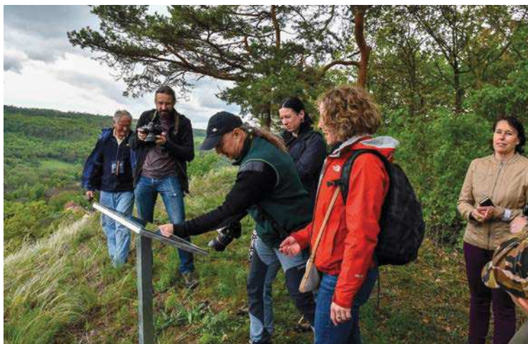
▲ Na vyhlídce (při slavnostním otevření naučné stezky).

Úvodní tabuli stezky nalezneme na autobusové zastávce Bžany, Lbín, na západním úpatí Supího vrchu. Zde se dozvíme základní informace o lokalitě a najdeme také jednoduchou mapku, kudy na vrchol. Jedná se sice s Klubem českých turistů o přesunutí červeně značené trasy do Hradiště, která v současné době vede výhradně po silnici, právě po hřebeni Supího vrchu, zatím k tomu však nedošlo, a tak je nutné spolehnout se na vlastní orientační smysl, případně na modrobílé reflexní šipky, které tu kdysi někdo napíchal