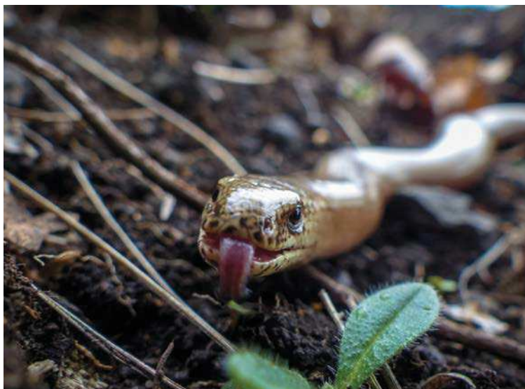
▲ Slepýš křehký.

Supí vrch není žádný velikán, nadmořská výška „vrcholu“ se uvá- dí 259 m n. m., ale snad právě díky tomu je výhled odtud naprosto uni- kátní. Unikátní nejen tím, co vidíme, ale hlavně tím, co nevidíme. Nevidí- me, že protější kopec (na starších ma- pách s kuriózním pojmenováním Na lepidlech) je vlastně ohromný kame- nolom, neb z této strany jeho plášť není narušen. Nevidíme, že jsme pouhé 4 kilometry od teplických síd- lišť. V okruhu do 15 kilometrů se na- chází rozsáhlá ústecká aglomerace s chemičkami, povrchové hnědouhel- né doly, tepelná elektrárna Ledvice, několik dálnic. Na Supím vrchu nic z toho netušíme. Vidíme jen lučinaté údolí s malebnými vesničkami, který- mi se klikatí řeka a lokální železnice, a kolem zalesněné svahy. Supí vrch je zkrátka takový „Hobitín“, skrytý před problémy vnějšího světa, byť ty hrozí nedaleko. ■