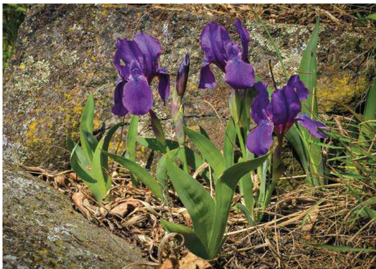
▲ Kosatec bezlistý .