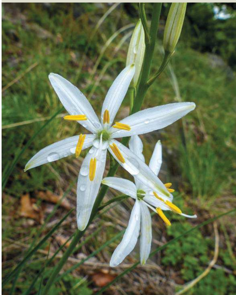
▼ Bělozářka liliovitá .

na stromy. Trasa však není orientačně náročná. Pěšina vede přes louku podél plotu k blízkému lesu, zde zatáčí vpravo a pak již stále nahoru, po okraji paseky a po skalnatém hřebínku. Skalky jsou tvořeny olivinickým čedičem, pro čedič charakteristickou sloupcovou odlučnost zde však nenajdeme. Skály mají spíše charakter bochníků či kamenné mozaiky.