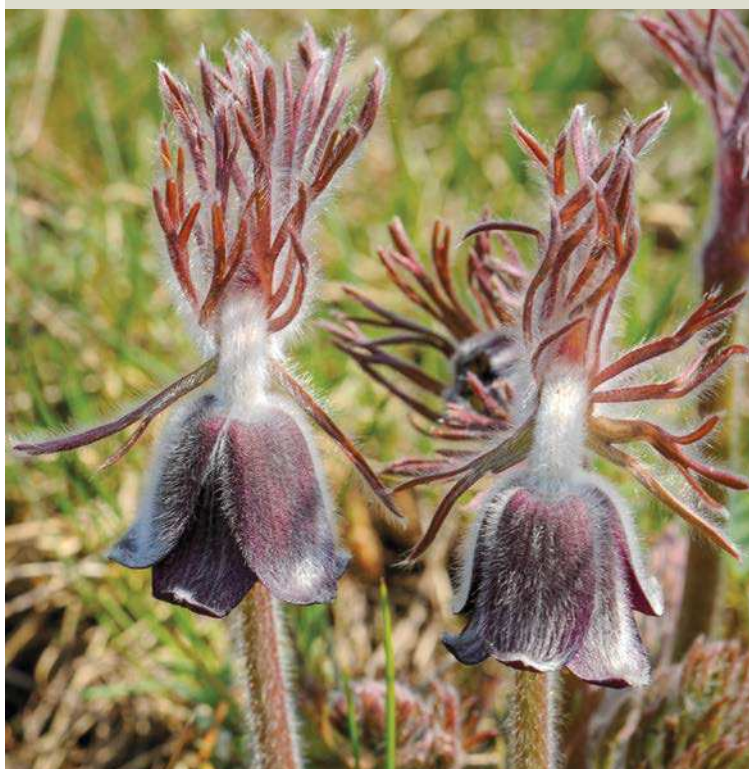
▼ Koniklec luční.