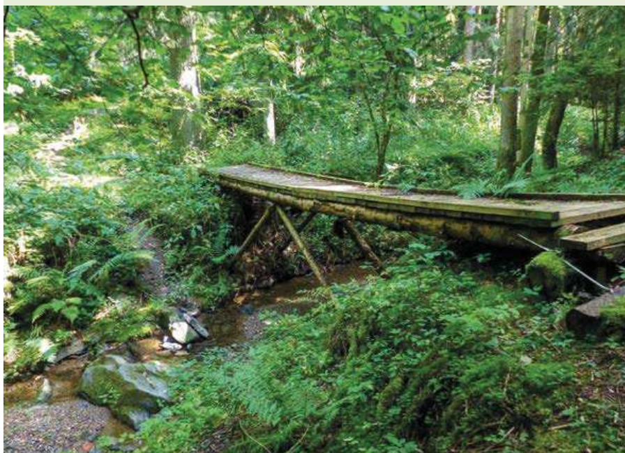
▼ Lávka přes Olešenský potok