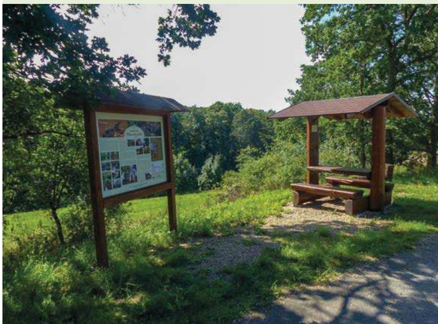
▲ Začátek naučné stezky - úvodní panel a odpočívadlo