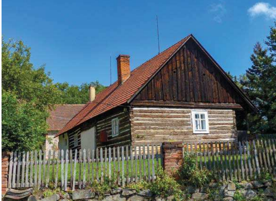
▲ Roubené stavení ve vsi Olešná

Olešenský potok pramení v polích jihovýchodně od Olešné. Až v druhé polovině svého toku, pod vsí, se však