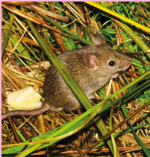
Myš domácí (Foto David Říha)

Zkuste si na mě nastražit tzv. živolovnou pastičku, do které se chytím, vy si mne prohlédnete a pak odnesete vypustit někam ven do přírody. Jako návnadu můžete vyzkoušet různou potravu a ověřit si tak, co nám myškám nejvíc chutná – osvědčí se skutečně nejlíp sýr nebo třeba salám, opečený kousek chleba, kousek sardinky, jablíčko, piškot...? Pasti kontrolujte několikrát denně, ať se chycená myška netrápí. Opatrně ji prozkoumejte a co nejdříve vypusťte do přírody. Možná chytíte různé druhy myšek – zvláště, pokud budete chytat třeba na chalupě v přírodě. Zkuste si porovnat myš domácí s myšicí lesní: Která je větší? Která má větší uši? Jak se liší zbarvením kožičku?