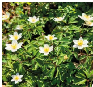
Sasanka hajní.