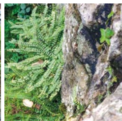
Příklad kapradiny rostoucí na skále.