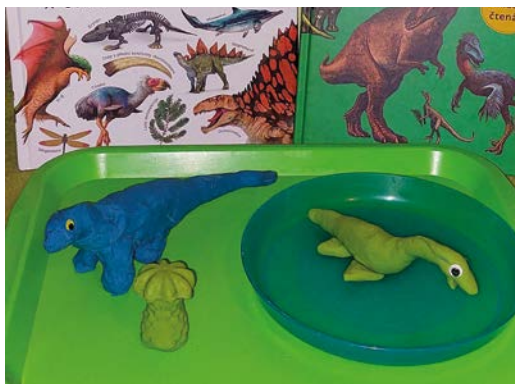
Vymodelování dinosaurů Edmontosaurus a Elasmosaurus .

Zkuste si v atlasu dinosaurů vyhledat obrázky druhů začínajících na „E“ a přečtete si o nich zajímavosti. Spolu s kamarády si můžete dinosaury třeba vymodelovat z modelovací hmoty a sestavit si vlastní dinopark i s tvorbou informačních tabulí s nejzajímavějšími fakty! Napovíme vám, že v takovém dinoparku můžete mít třeba druhy Edmontosaurus , Edafosaurus , Edmontonia , Elasmosaurus , Eoraptor , Eudimorphodon ... Už jsme moc zvědaví na vámi zasláné fotografie vymodelovaných figurek či celých dinoparků!