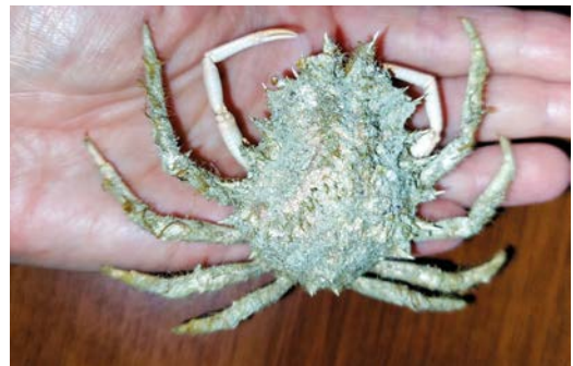
Příklad exoskeletu karapax kraba.

Endo/exo skelet je vypevnění živočišného těla buď zevnitř, nebo zvenku. Endoskelet je chrupavčitá či kostěná kostra u obratlovců (pařby, ryby, obojživelníků, plazů, ptáků a savců). Exoskelet je vnější opora těla bezobratlých ve formě pevné pokožky či krunyře hmyzu, pavouků, koryšů a dalších členovců. Exoskelet na rozdíl od endoskeletu spolu s živočichem neroste, živočich jej při svém růstu musí svlékat – několik dní je pak zranitelný, dokud mu nový pokryv těla postupně neztuhne.