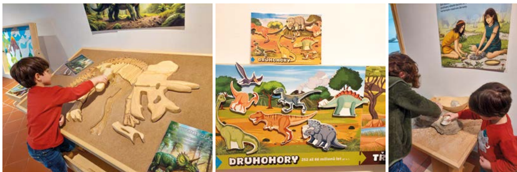
Ukázka aktivit z interaktivní výstavy Výlet zpět o miliony let.

Evoluce je možná nejdůležitějším slovem pro dnešní přírodovědce. Evoluce je samovolný proces, který vede k proměně a vývoji nových forem života od jeho prvopočátku až dodnes. Zakladatelem moderní evoluční teorie byl Charles Darwin. Propojil ji s teorií přírodního výběru, která říká, že do budoucna přežívají formy života, které mají oproti ostatním nějakou výhodu – jsou tedy lépe přizpůsobené k prostředí, v němž žijí. Důkazem jsou paleontologické nálezy a také studium DNA, jejíž části potvrzují příbuzenské vztahy mezi živými organismy. Během výuky přírodopisu se určitě setkáte s evolucí celé naší Země, s evolucí rostlin a živočichů, i člověka. Zkuste najít nějakou zábavnou formu, kterou se o evoluci budete učit. Vymyslíte třeba veselou pohybovou hru? Nebo si půjčte a zahrajte společenskou hru Evoluce třeba z půjčovny her – víte vůbec, že takové půjčovny existují? Nabízí je např. některé knihovny nebo je můžete najít i na internetu. Nebo zajděte do nějakého muzea, které evoluci či její část zachycuje. Doporučit můžeme třeba přírodovědnou expozici v olomouckém Vlastivědném muzeu či putovní výstavu Výlet zpět o miliony let (sledujte aktuality na https://muzeum-sumperk.cz/ ). Můžete také malovat či tvořit z různých materiálů jednotlivé fáze vývoje. Už se těšíme na vaše nápady, které nám zašlete!