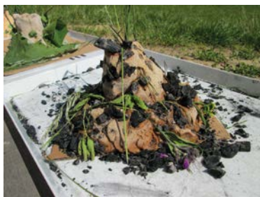
Pokus demonstrující erupci sopky a model sopky.

V předchozím úkolu jsme zmínili, že můžete použít figurky dinosaurů. Vulkanická činnost byla v době vlády dinosaurů na naší planetě poměrně častým jevem. Dinosaurů žilo na Zemi spousta druhů. Některé z nich také začínaly na písmeno E.