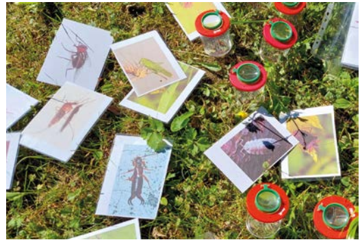
Patrání po obyvatelích půdy s dětmi s využitím kelímkových lup.

Endo/exo skelet je vypevnění živočišného těla buď zevnitř, nebo zvenku. Endoskelet je chrupavčitá či kostěná kostra u obratlovců (pařby, ryby, obojživelníků, plazů, ptáků a savců). Exoskelet je vnější opora těla bezobratlých ve formě pevné pokožky či krunyře hmyzu, pavouků, koryšů a dalších členovců. Exoskelet na rozdíl od endoskeletu spolu s živočichem neroste, živočich jej při svém růstu musí svlékat – několik dní je pak zranitelný, dokud mu nový pokryv těla postupně neztuhne.