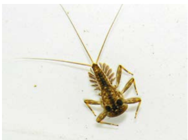
Larvy různých druhů jepic.