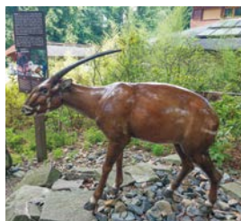
Model saoly v ZOO Ostrava.

Epityf je „přisedavá“ rostlina, která se svými kořeny přichytává na jinou rostlinu, případně jiný pevný podklad, a nepotřebuje ke svému životu zeminu. Tyto rostliny se tak dostávají blíže ke světlu, ale mívají nedostatek živin a vody. Takové rostliny od parazitických rostlin, jako je např. jmelí, rozeznáme tak, že i po odumření rostliny, na níž rostou, přežijí. Nejznámější jsou asi tropické orchideje a bromelie. Ty je nyní moderní pěstovat také v domácnostech v tzv. vzdušných zahradách. V naší české přírodě žijí epifyticky různé mechy, kapradiny či břečťany.